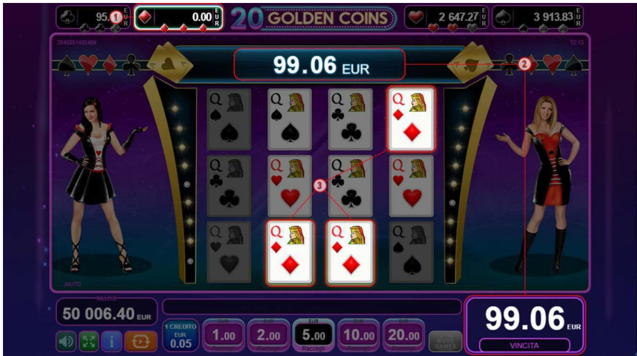
Fig. 10 Gioco bonus Jackpot Cards

mostrato sul lato destro di ogni seme. L'importo vinto viene trasferito al campo "Vincita" (fig. 10 (2)), e per aggiungerlo al proprio saldo il giocatore preme il tasto "Raccogli", terminando così il round bonus.