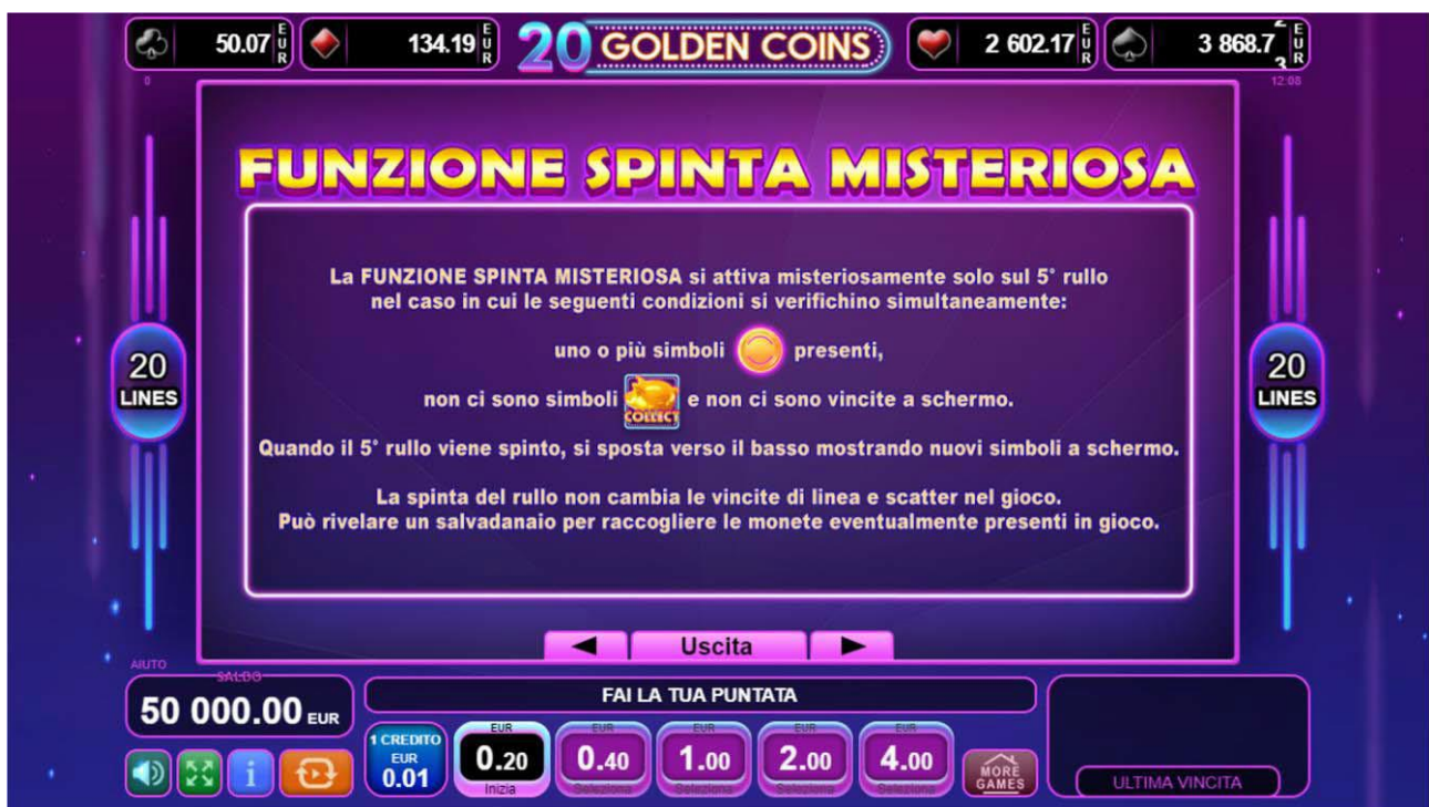
Fig. 4 Menù tabella pagamenti – Funzione Spinta Misteriosa