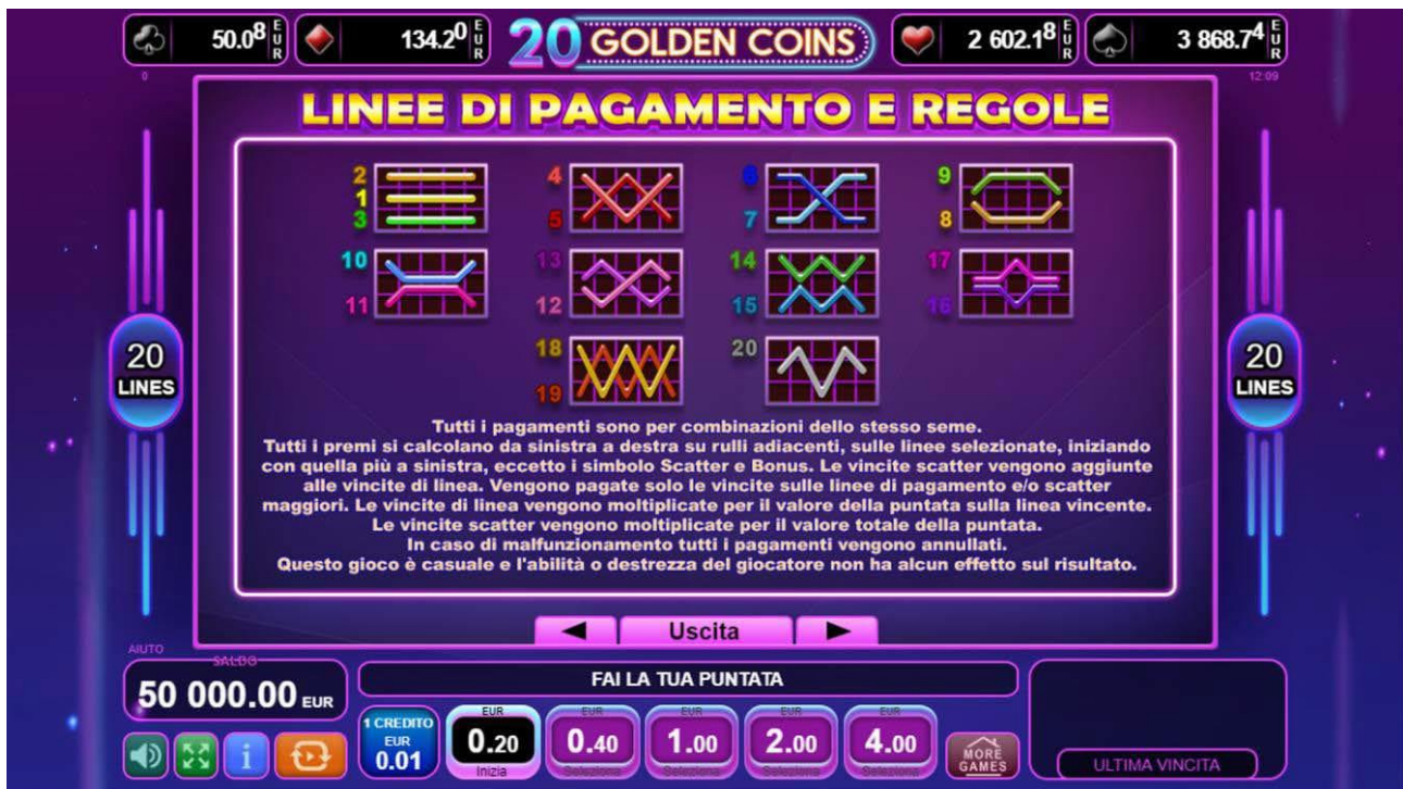
Fig. 7 Menù tabella pagamenti – Linee di Pagamento e Regole