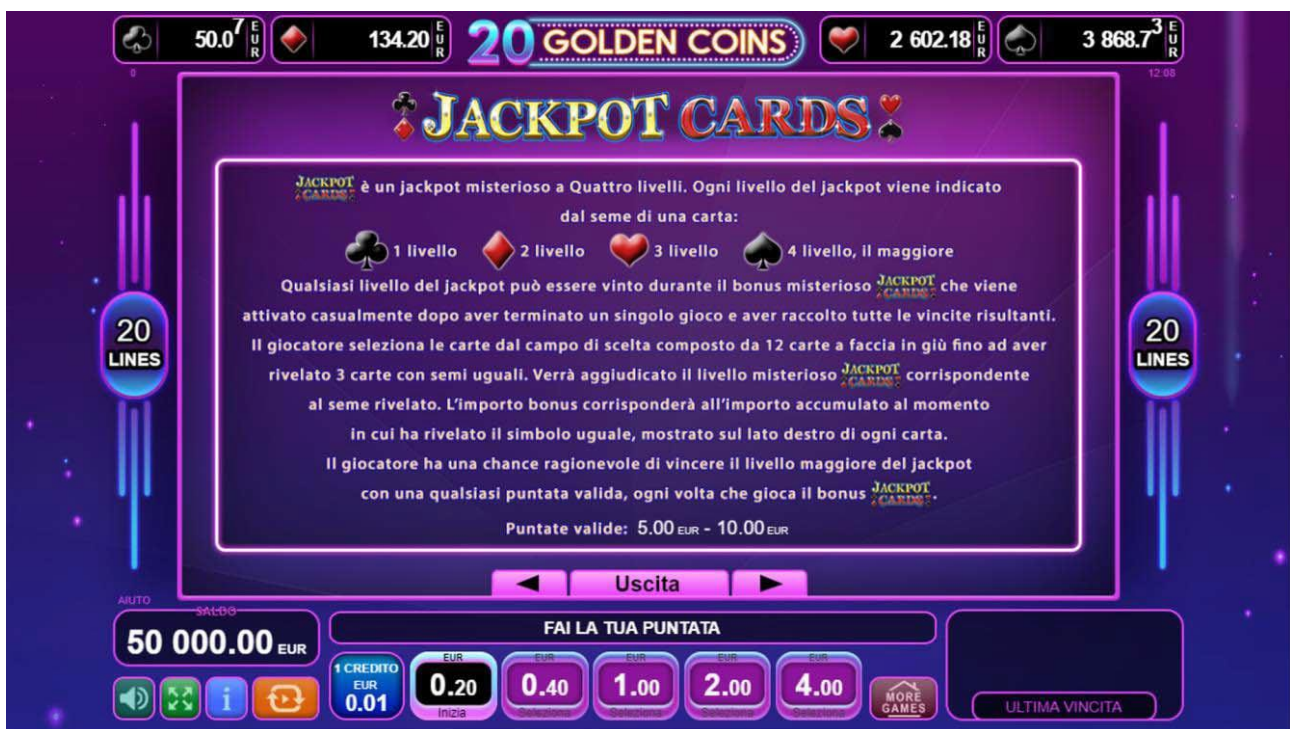
Fig. 6 Menù tabella pagamenti – Gioco bonus Jackpot Cards