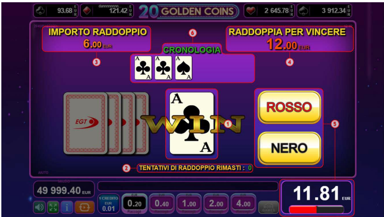
Fig. 9 Funzione Raddoppia

Se compare una combinazione vincente e il tasto Raddoppia viene attivato, dalla schermata principale del gioco, il giocatore viene portato allo schermo rotondo Raddoppia (fig.9). L'obiettivo del gioco è indovinare correttamente il colore della carta coperta (fig.9 (1)). La dicitura „Importo Raddoppio” (fig.9 (3)) mostra l'importo che il giocatore desidera raddoppiare. La dicitura “Raddoppia per Vincere” (fig.9 (4)) dimostra l'importo che il giocatore può vincere indovinando il colore corretto della carta. Sono presenti due tasti per scegliere “Nero” e “Rosso” (fig.9 (5)).