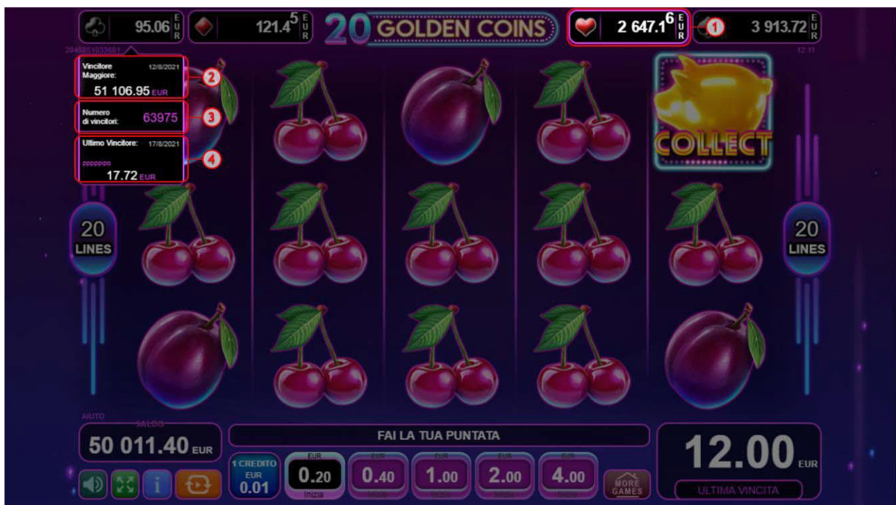
Fig. 11 Jackpot Pannello