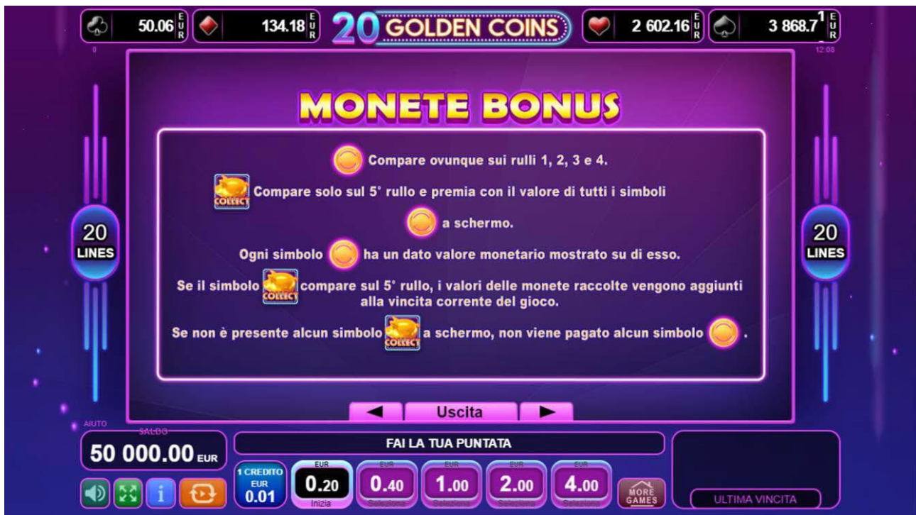
Fig. 3 Menù tabella pagamenti – Simboli speciali