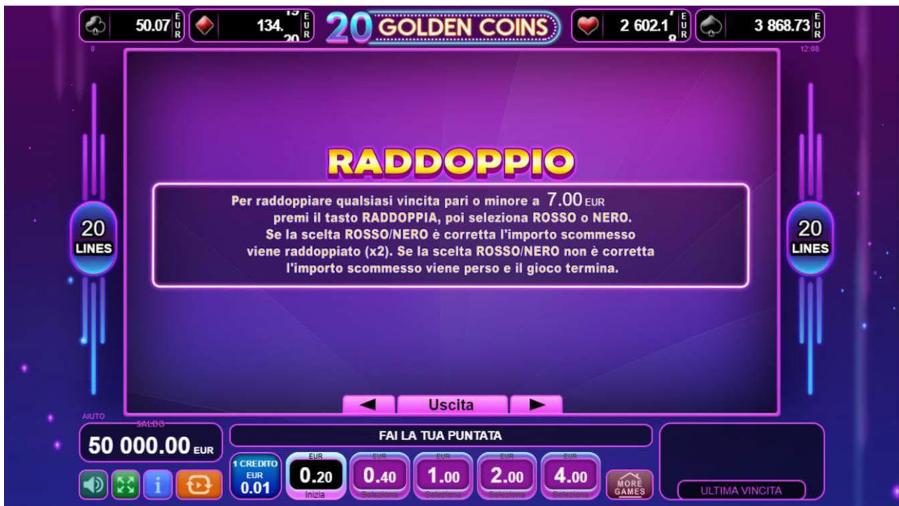
Fig. 5 Menù tabella pagamenti – Raddoppia