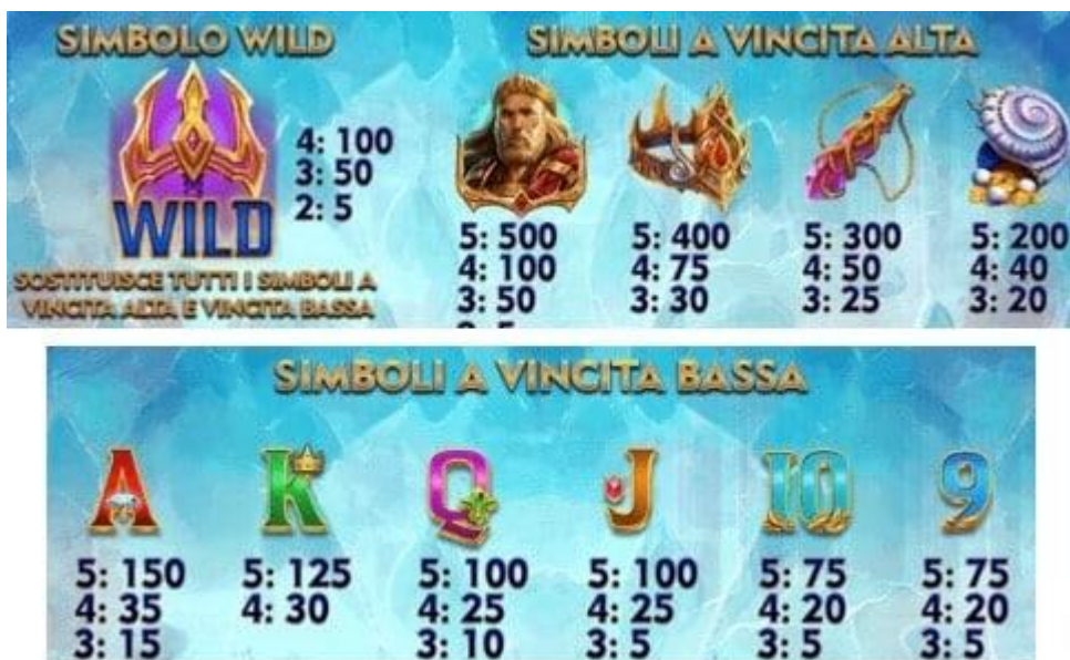
TABELLA DEI PAGAMENTI

In caso di malfunzionamento, tutte le giocate e le vincite vengono annullate.