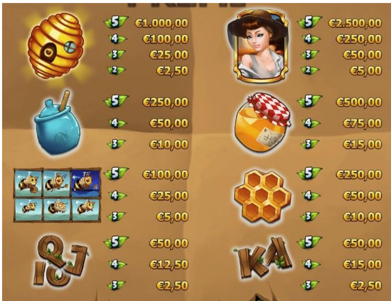
TABELLA DEI PAGAMENTI (relativa ad una giocata di 5,00 €)