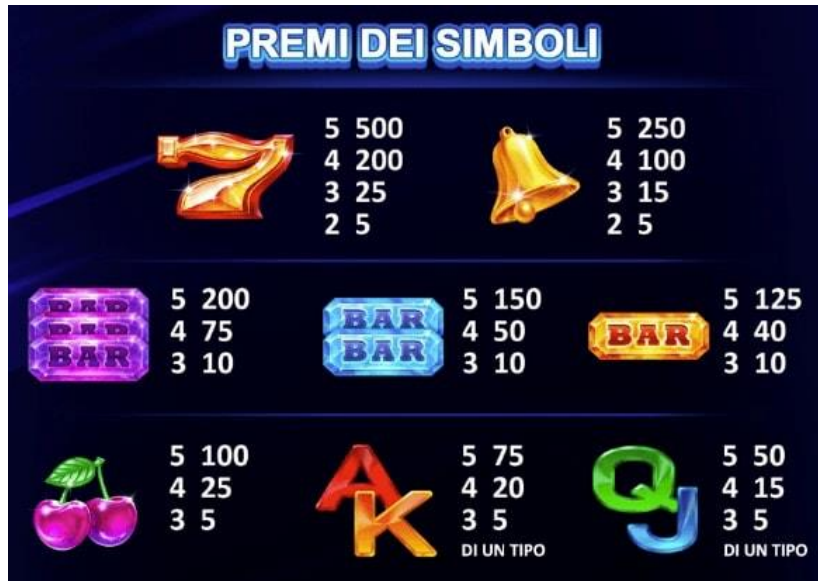
TABELLA DEI PAGAMENTI