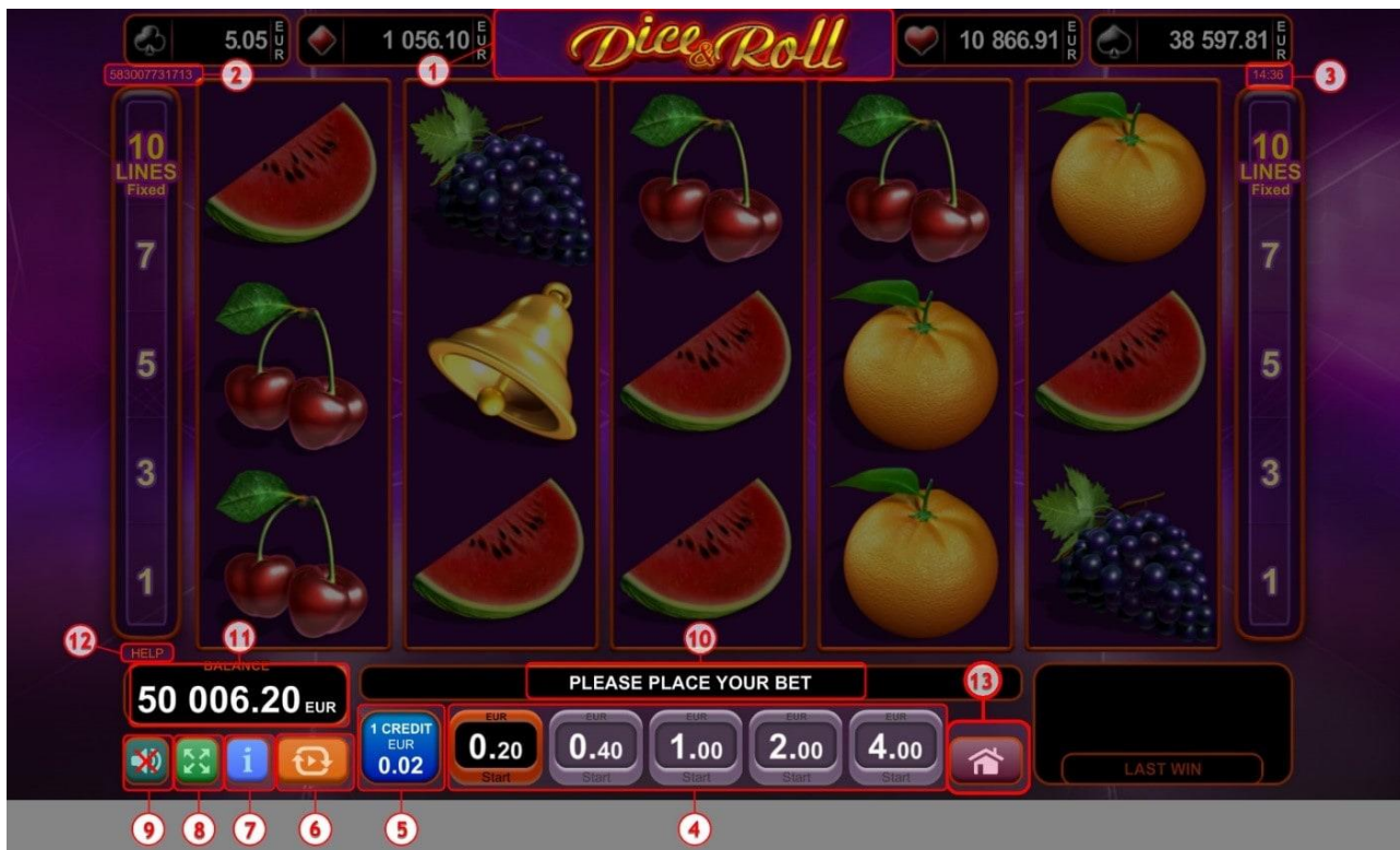
Fig. 1 Schermata principale della video slot Dice & Roll