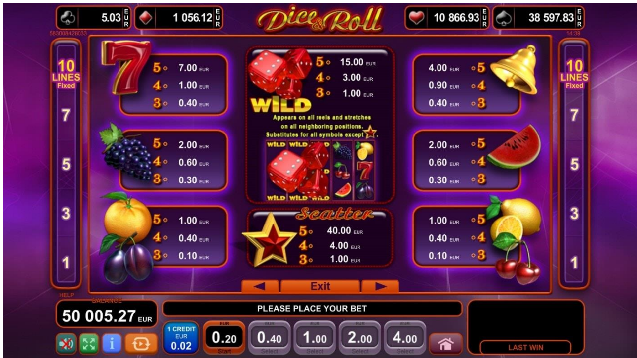
Fig. 2 Menù della Tabella pagamenti - Pagamenti

Il menù della Tabella pagamenti della video slot Dice & Roll consiste di 4 pagine (fig. 2, 3, 4 e 5). Le pagine da fig. 3 e 4 sono presenti solo se la funzione “Raddoppia” e il gioco bonus “Jackpot Cards” sono abilitati. Se il gioco bonus Jackpot cards è abilitato, nella parte superiore dell’interfaccia di gioco sarà mostrato un pannello con quattro contenitori, che dimostra la progressione dei quattro livelli in tempo reale.