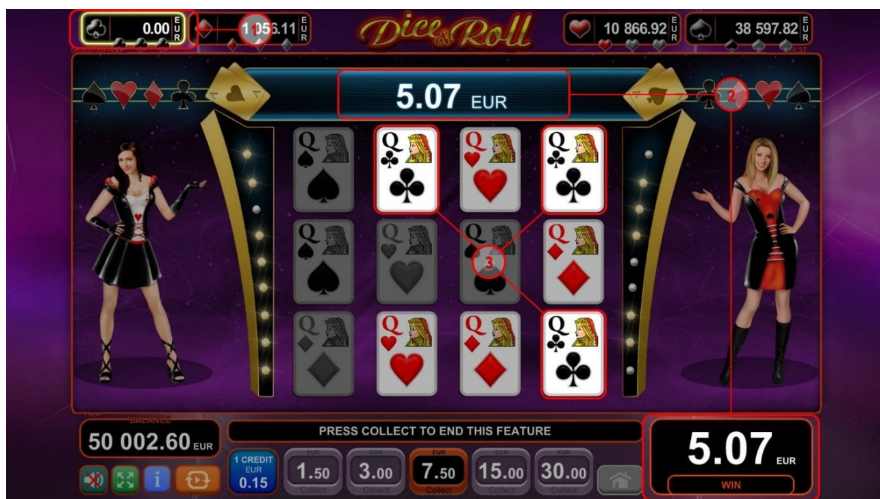
Fig. 7 Gioco bonus “Jackpot Cards”

L'importo bonus corrisponde all'importo accumulato quando viene rivelato l'ultimo simbolo uguale, mostrato sul lato destro di ogni seme. L'importo vinto viene trasferito al campo “Vincita” (fig. 7 (2)), e per aggiungerlo al proprio saldo il giocatore preme il tasto “Raccogli”, terminando così il round bonus.