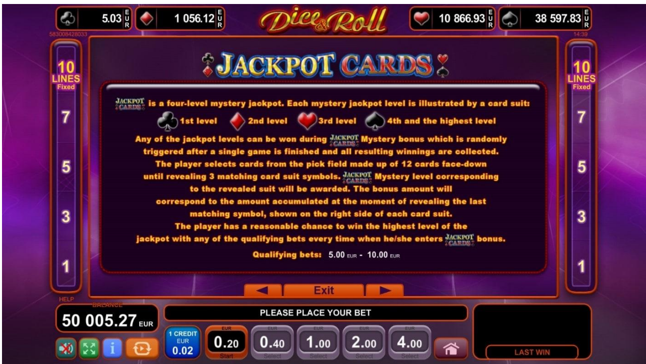
Fig. 4 Menù della Tabella pagamenti - Gioco bonus "Jackpot cards"