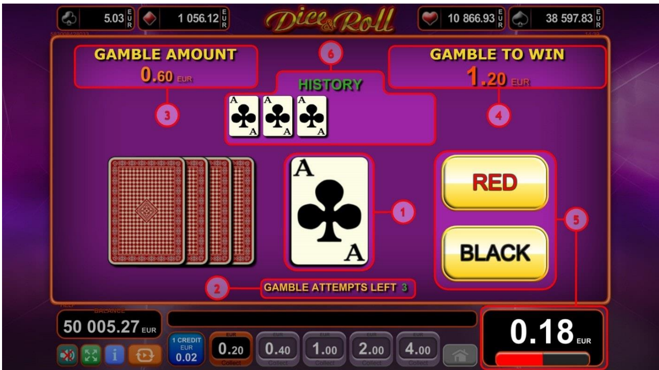
Fig. 6 Funzione Raddoppia

Se compare una combinazione vincente e il tasto Raddoppia viene attivato, dalla schermata principale del gioco, il giocatore viene portato allo schermo rotondo Raddoppia (fig.6). L'obiettivo del gioco è indovinare correttamente il colore della carta coperta (fig.6 (1)).