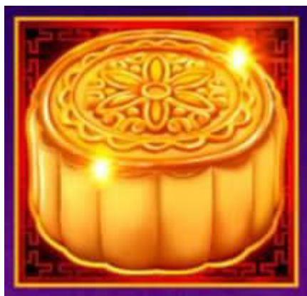
Figura 5 Simbolo Torta Lunare

Il simbolo Scatter è rappresentato dalla Torta Lunare. 3 o più simboli Scatter in qualsiasi posizione attivano la Funzione Torta Lunare Simboli Wild: