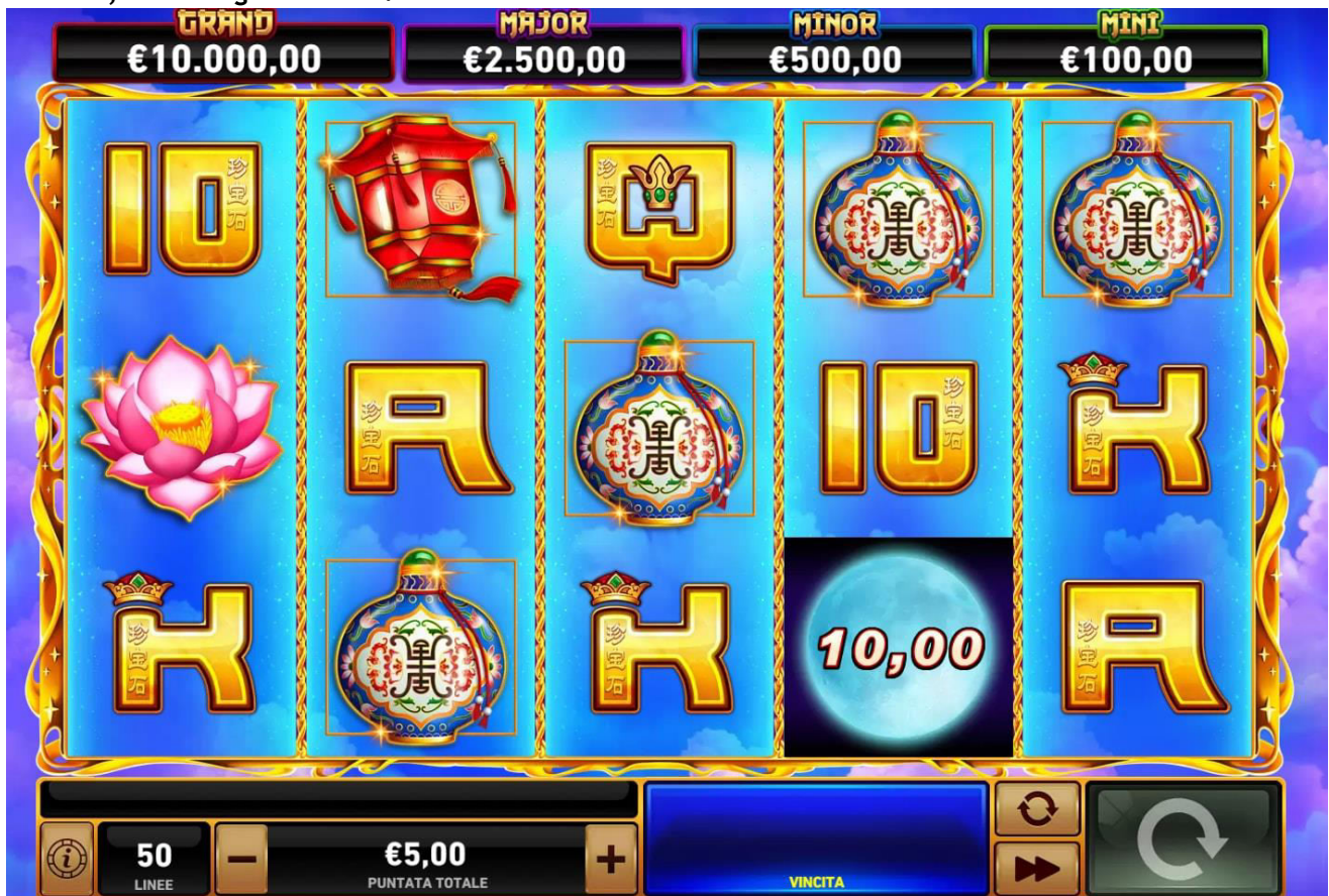
Figura 1 Schermata principale

Slot a 5 rulli e 50 linee, lo scopo di ETERNAL LADY è quello di ottenere combinazioni di simboli vincenti, facendo girare i rulli.