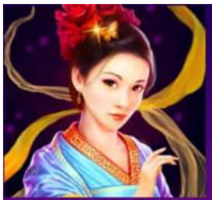
Figura 6 Simbolo Wild

Il simbolo Scatter è rappresentato dalla Torta Lunare. 3 o più simboli Scatter in qualsiasi posizione attivano la Funzione Torta Lunare Simboli Wild: