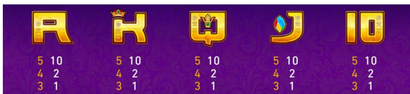
figura 4 tabella dei pagamenti 3