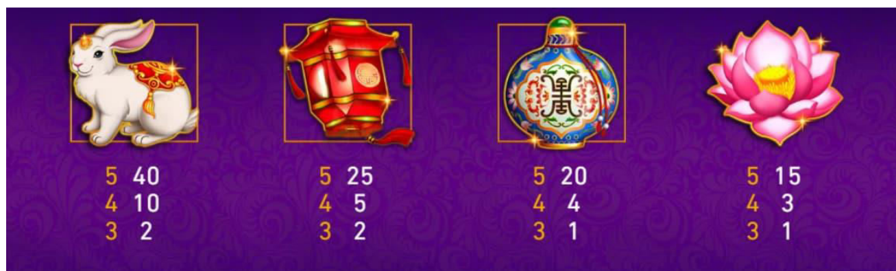
Figura 3 tabella dei pagamenti 2