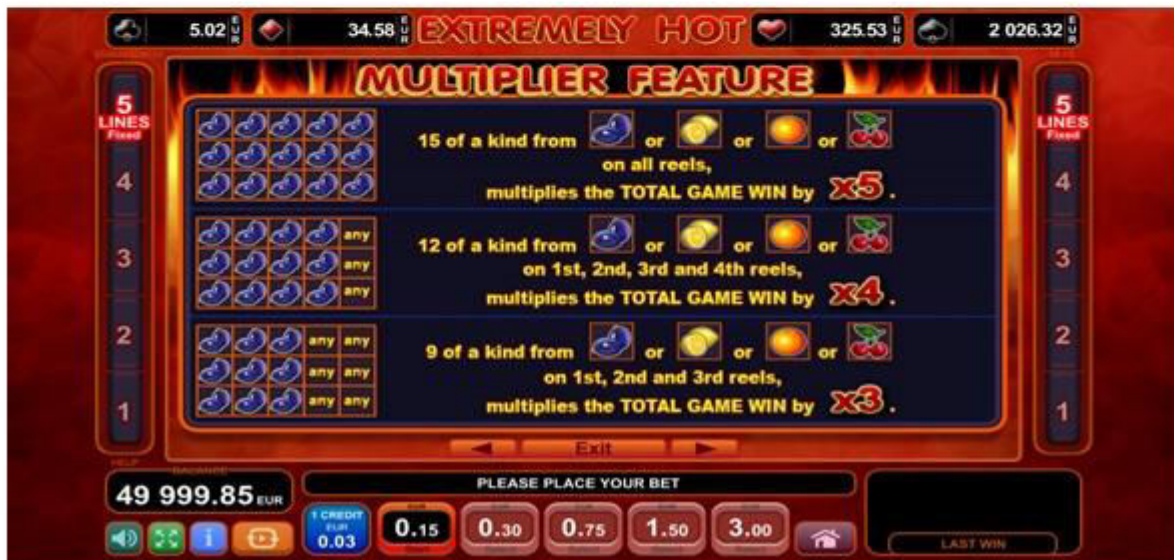
Fig. 3 Menù della Tabella pagamenti – Funzione Moltiplicatore