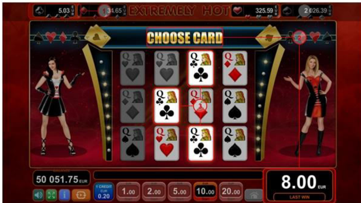
Fig. 8 Gioco bonus "Jackpot Cards"

L'importo vinto viene trasferito al campo "Vincita" (fig. 8 (2)), e per aggiungerlo al proprio saldo il giocatore preme il tasto "Raccogli", terminando così il round bonus.