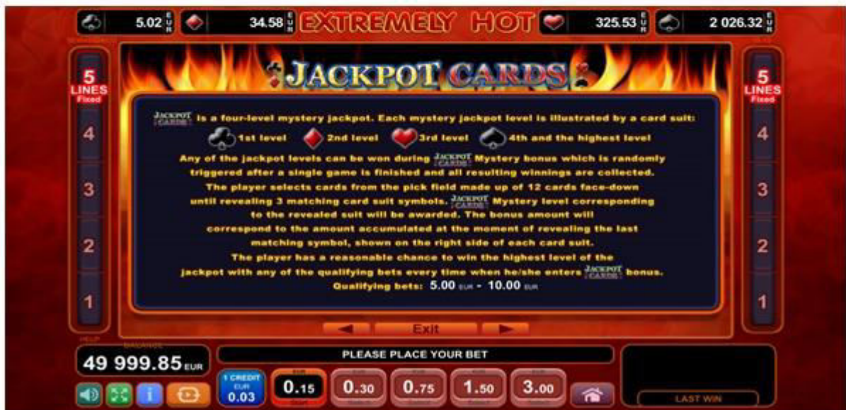
Fig. 5 Menù della Tabella pagamenti – Gioco bonus "Jackpot cards"