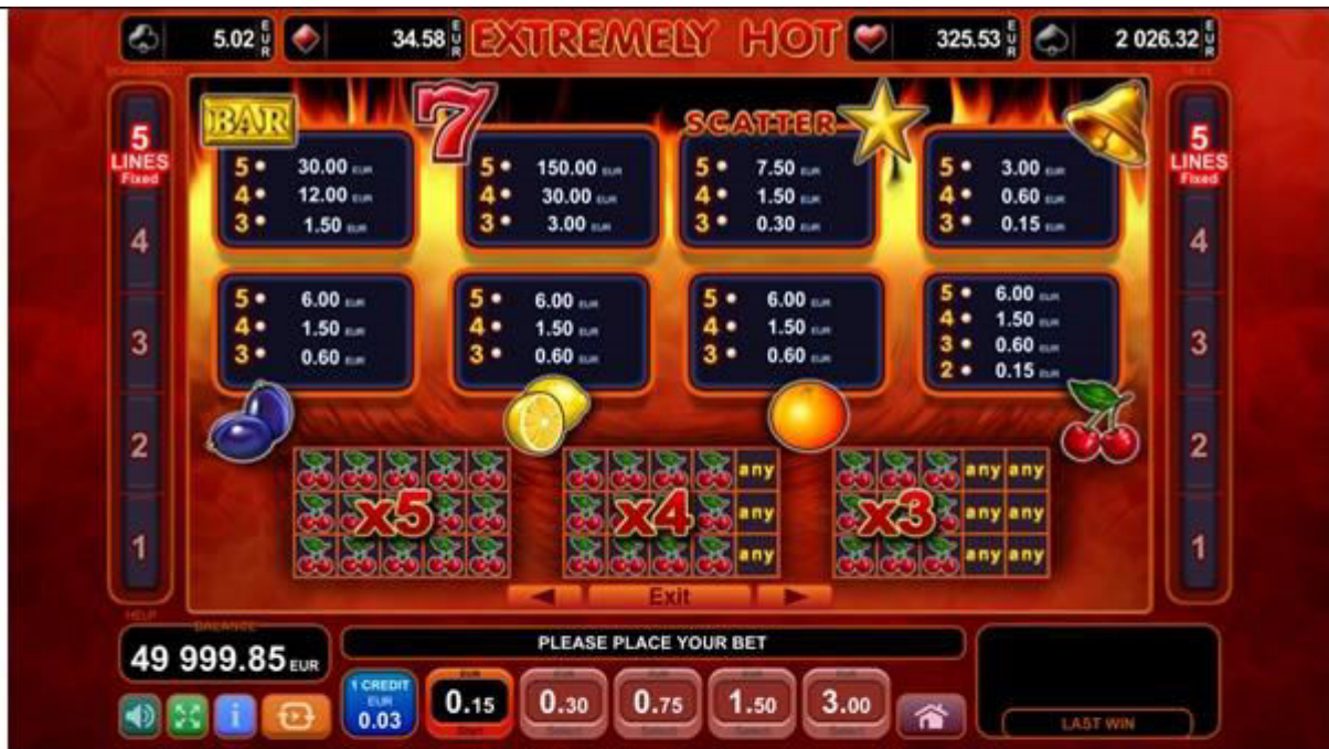
Fig. 2 Menù della Tabella pagamenti - Pagamenti