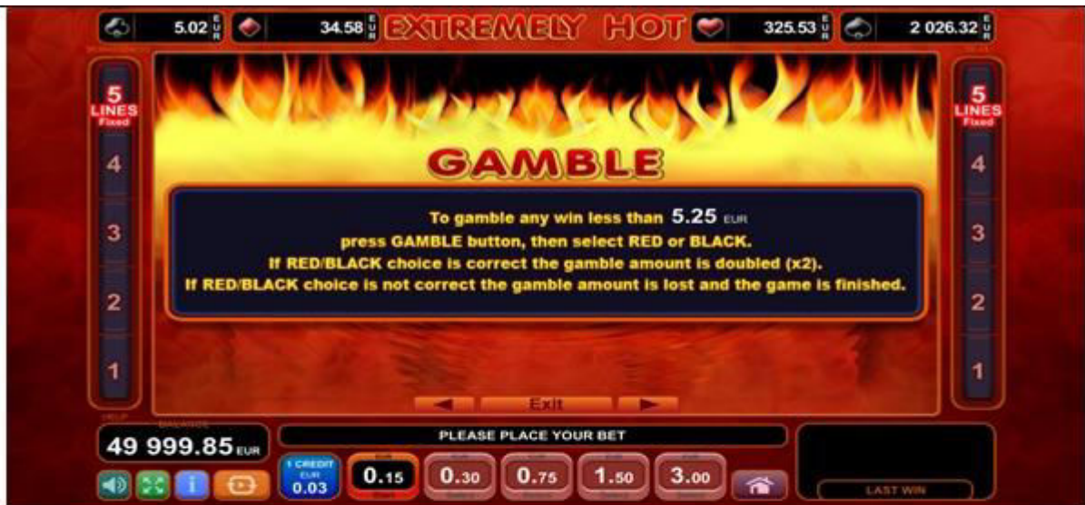
Fig. 4 Menù della Tabella pagamenti - Raddoppia