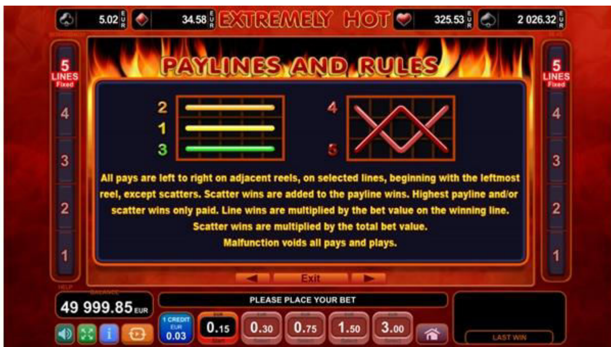
Fig. 6 Menù della Tabella pagamenti – Linee di Pagamento e Regole