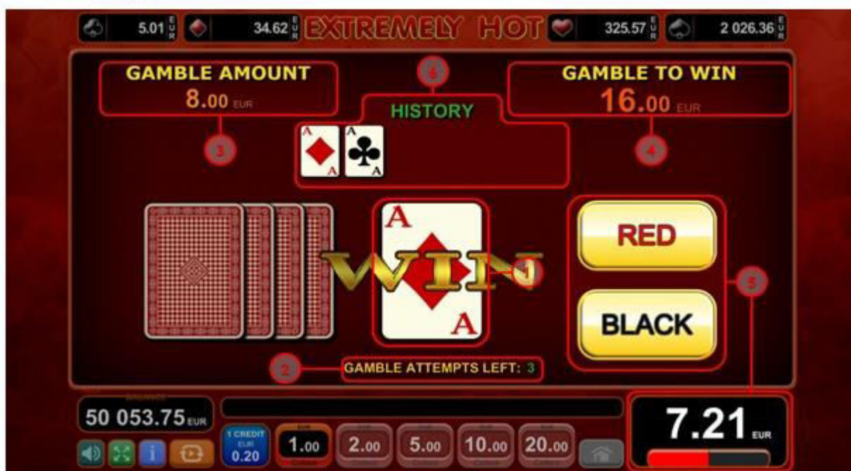
Fig. 7 Funzione Raddoppia

Se compare una combinazione vincente e il tasto Raddoppia viene attivato, dalla schermata principale del gioco, il giocatore viene portato allo schermo rotondo Raddoppia (fig. 7).