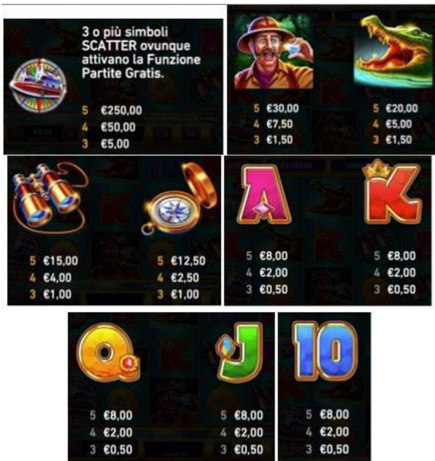
TABELLA DEI PAGAMENTI