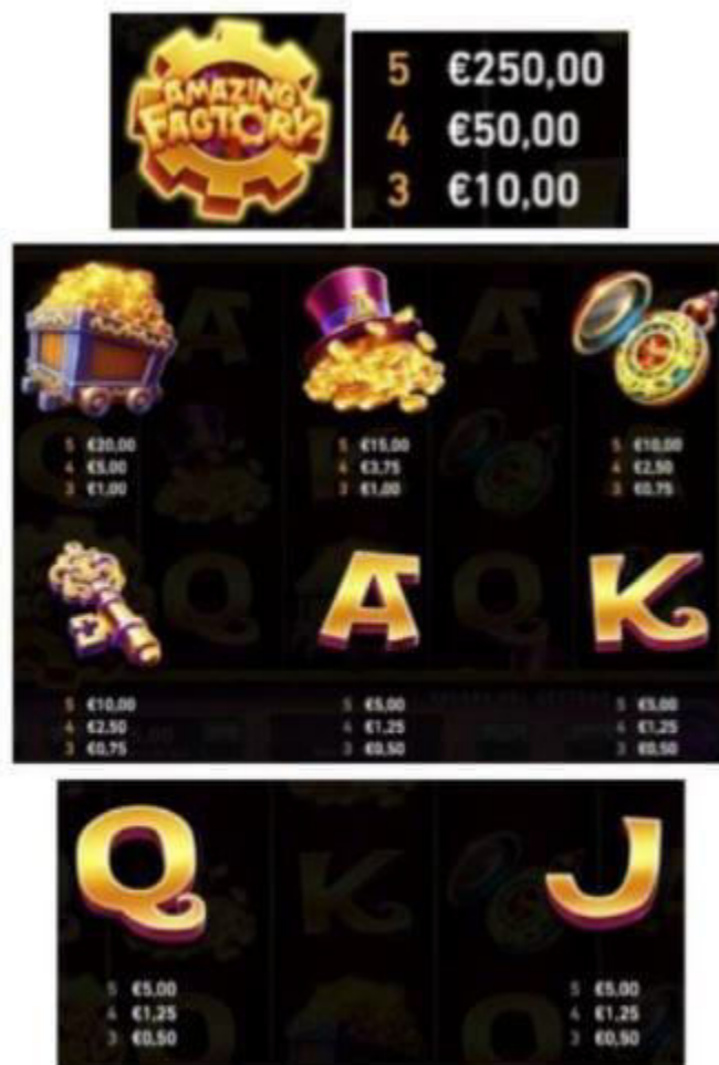
TABELLA DEI PAGAMENTI (relativa ad una puntata di 5 €)