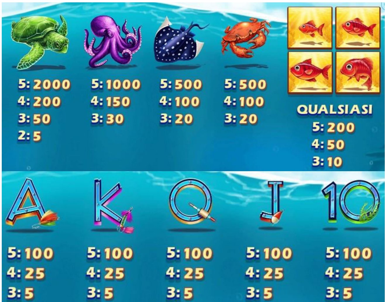
TABELLA DEI PAGAMENTI