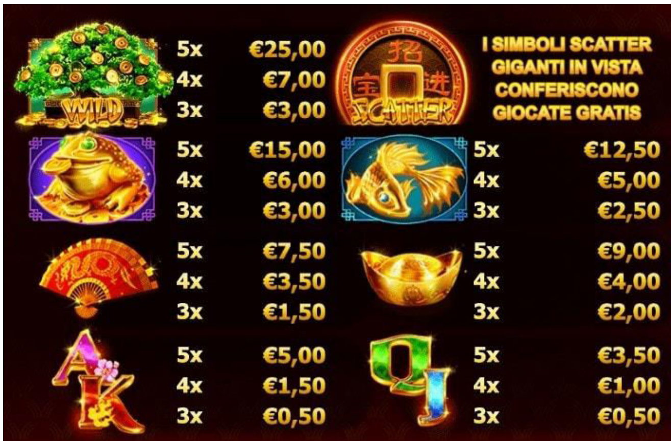
TABELLA DEI PAGAMENTI (per una giocata di € 5,00)