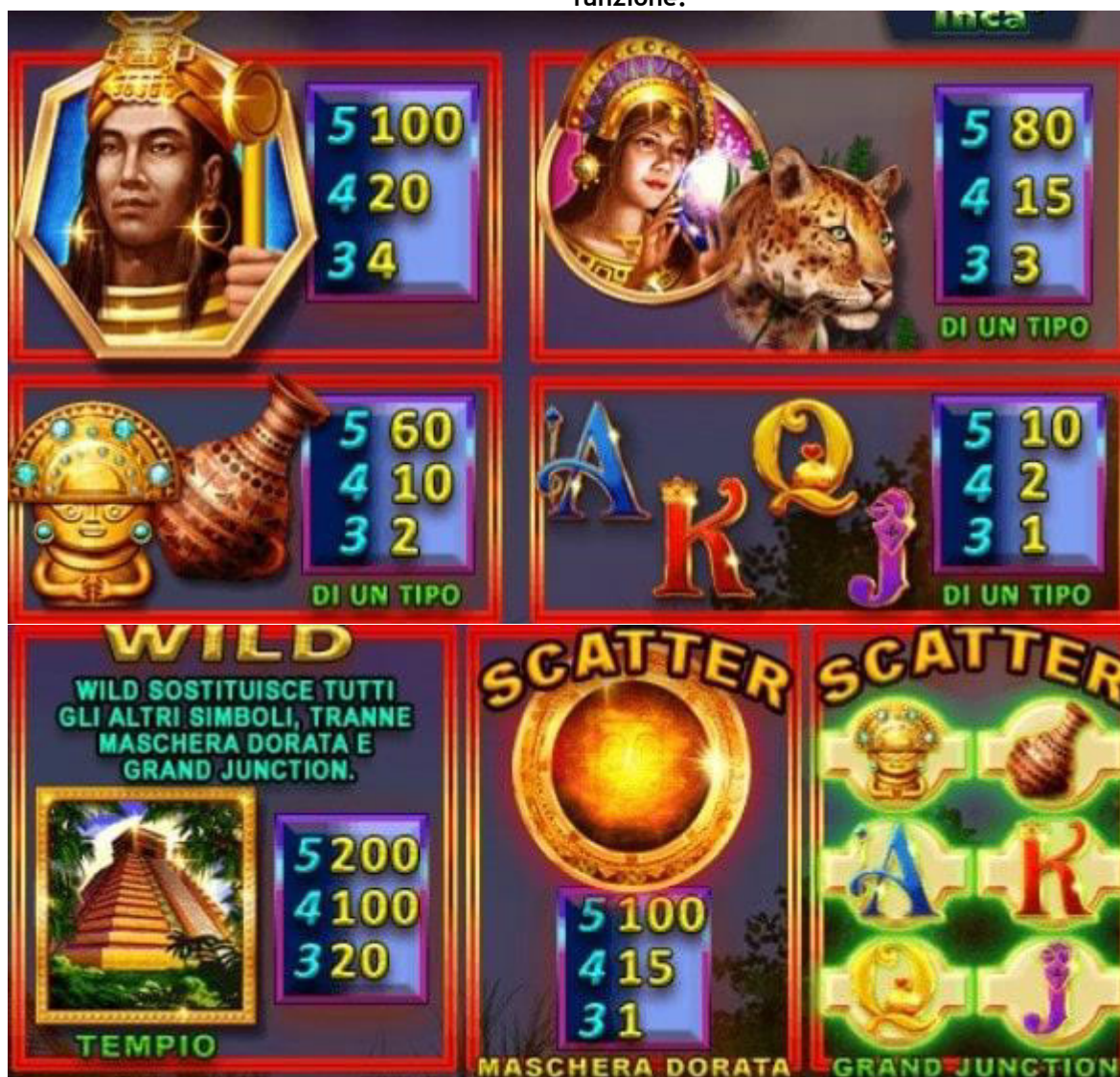
TABELLA DEI PAGAMENTI

Una volta completate tutte le Partite Gratis, appare una schermata che mostra la vincita totale della funzione.