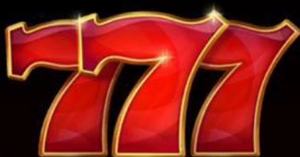
TABELLA DI VINCITA