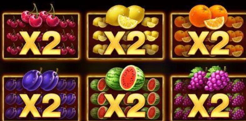
TABELLA DI VINCITA Moltiplicatore

Novi simboli identici sullo schermo raddoppiano la vincita!