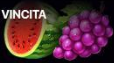
TABELLA DI VINCITA