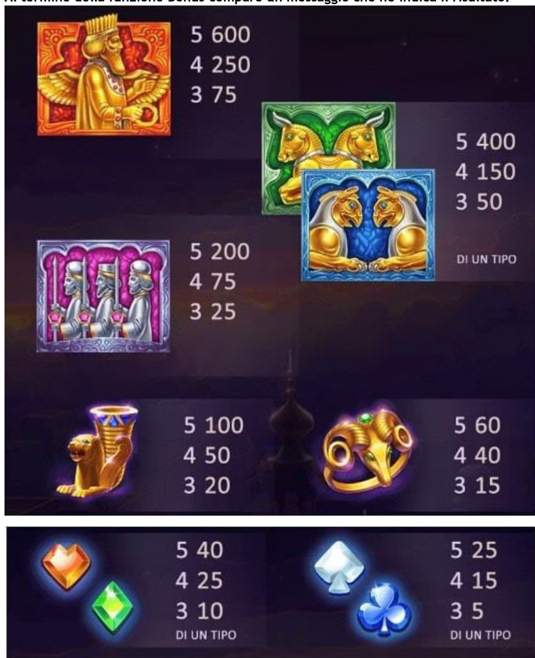
TABELLA DEI PAGAMENTI

in denaro e successivamente la funzione termina assegnando la vincita totale. Al termine della funzione Bonus compare un messaggio che ne indica il risultato.