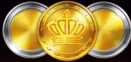
TABELLA DI VINCITA

3 simboli Bonus attivano il Gioco Bonus.