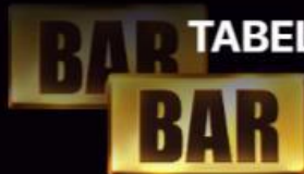
TABELLA DI VINCITA