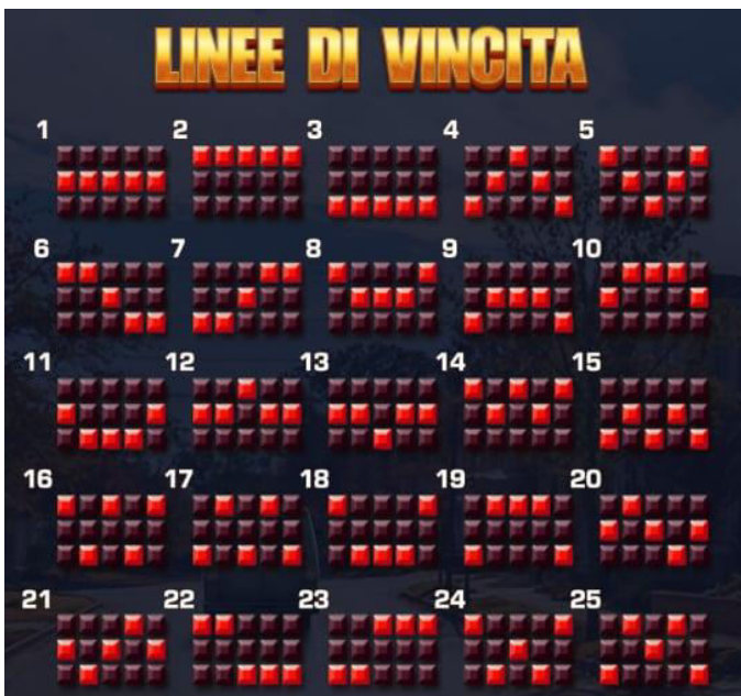
Linee di vincita