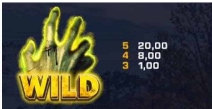
Tabella dei pagamenti