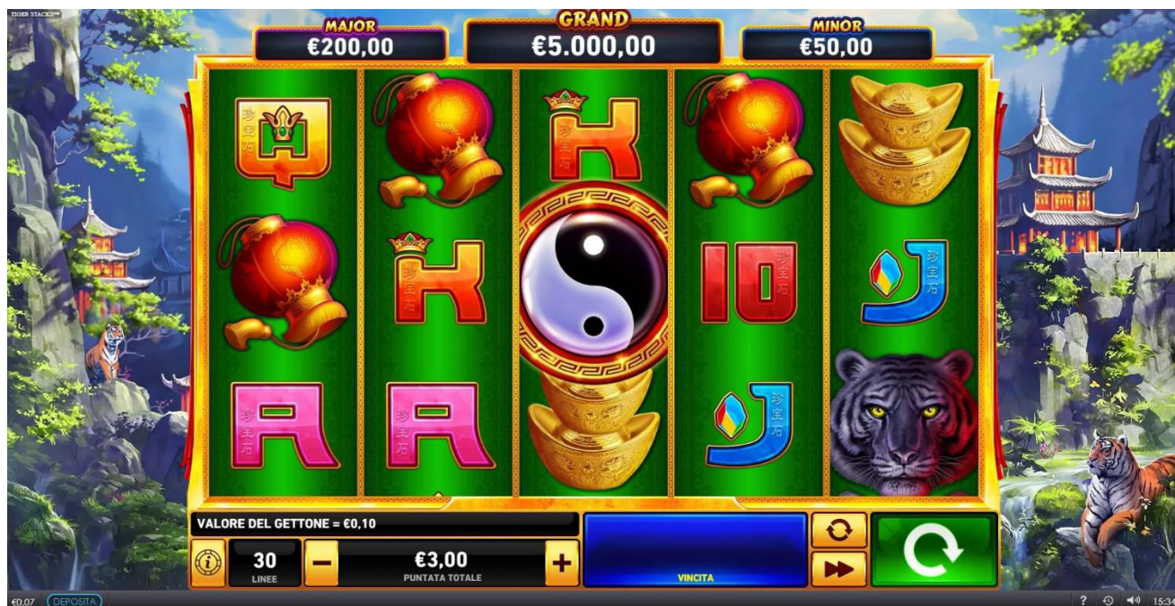
Figura 1 Schermata principale

Slot con 30 linee di vincita, lo scopo di Tiger Stacks è quello di ottenere combinazioni di simboli vincenti, facendo girare i rulli.