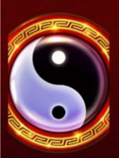
Figura 6 Simboli Scatter

Il simbolo Scatter è il Yinyang. 3 o più simboli Scatter ovunque sui rulli 1-3, a partire dal primo rullo a sinistra, attivano la Funzione Partite Gratis.