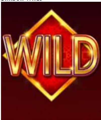
Figura 5 Simboli Wild

Il simbolo WILD del gioco è la scritta Wild